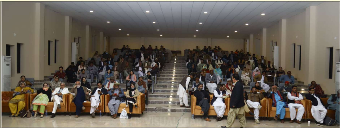
مشاعري ۾ شريڪ سامعين