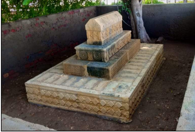
مرحوم معمر يوسفائي جي آخري آرامگاه لطيف نگر- عمرڪوٽ